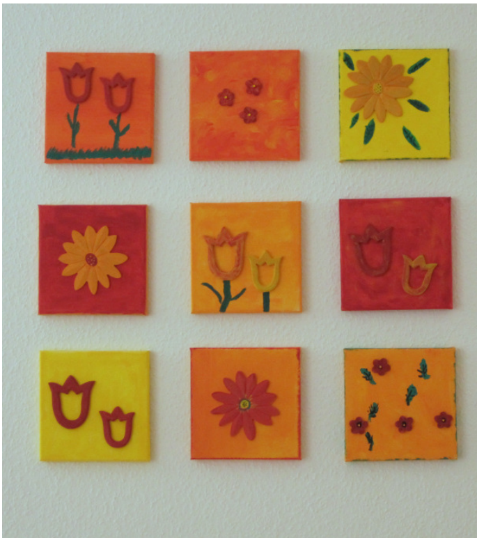
Wandschmuck, angefertigt von den Bewohnern des Stephansheims beim monatlichen Kreativen Gestalten des Diakonievereins